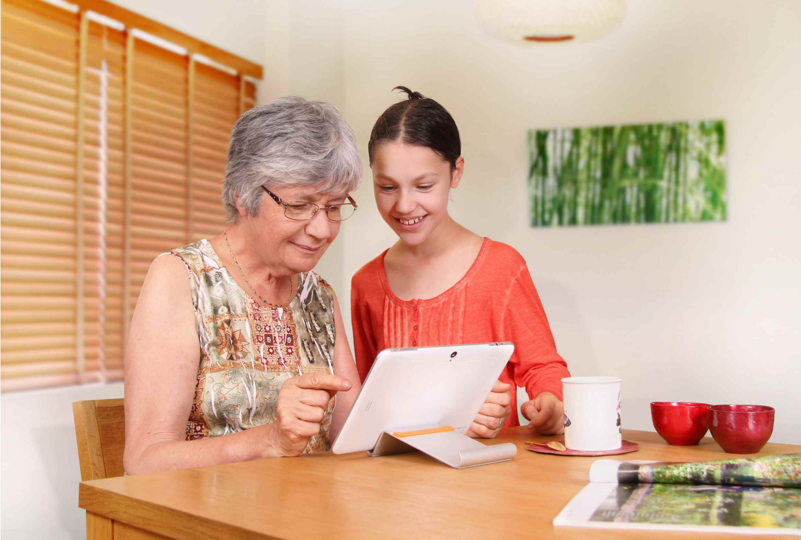
Ci-dessus le modèle FACILOTAB 10,1" (25 cm) sur son support multi-positions